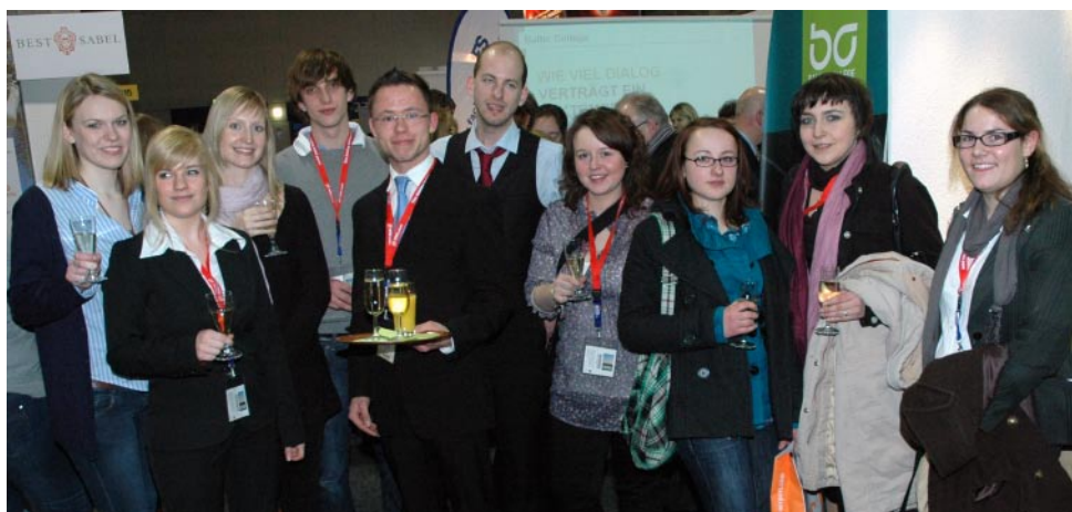
Fleißig bei der Standbetreuung: Studierende und Absolventen des Baltic College.

Täglich präsentierten Lehrende und Studierende des Baltic College ihre Hochschule, standen Interessierten Rede und Antwort und erweiterten das Netz von Kooperationspartnern. Der Erfolg des BC-Messestandes ist deutlich. Und bei der ITB 2011 wird das Baltic College noch für einen noch höheren Wert auf der touristischen Richterskala sorgen.